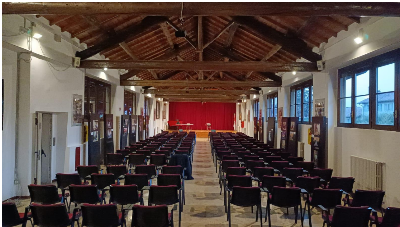
La storica sala Superiore di Cascina Robbiolo (1800)